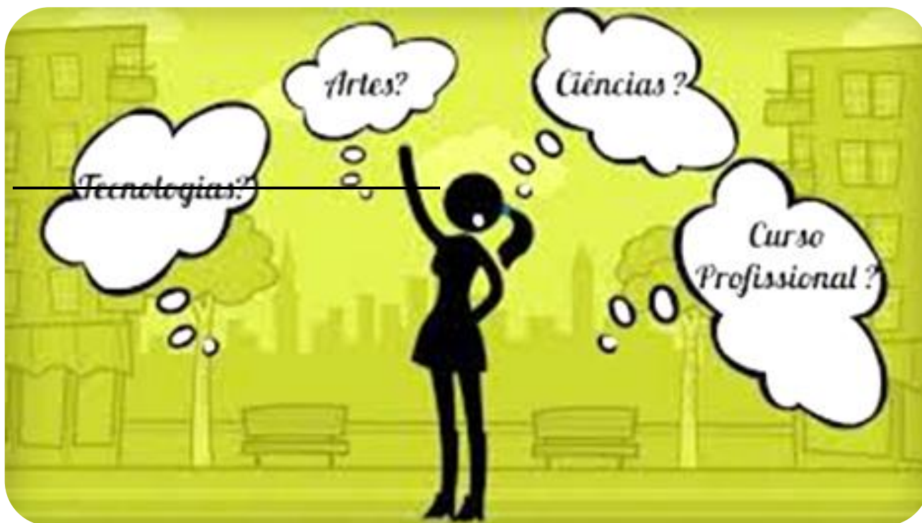
Figura 3 – Aprendizagens e Saberes

Em 2021, as “Aprendizagens e saberes” continuarão a fazer parte da vida crianças/jovens.