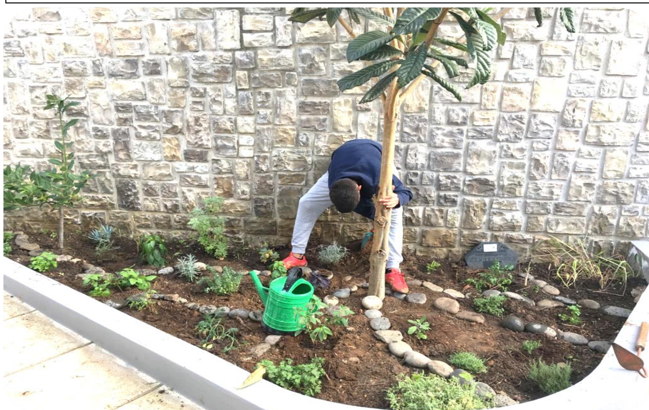
Figura 7 - Plantação e manutenção de ervas aromáticas

Tendo em conta a importância do ambiente na educação dos mais novos, pretendemos continuar com este projeto em 2021.