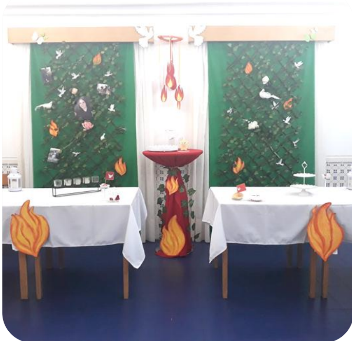
Figura 4 – Celebração Religiosa

Atendendo aos objetivos propostos, este projeto deverá continuar em 2020.