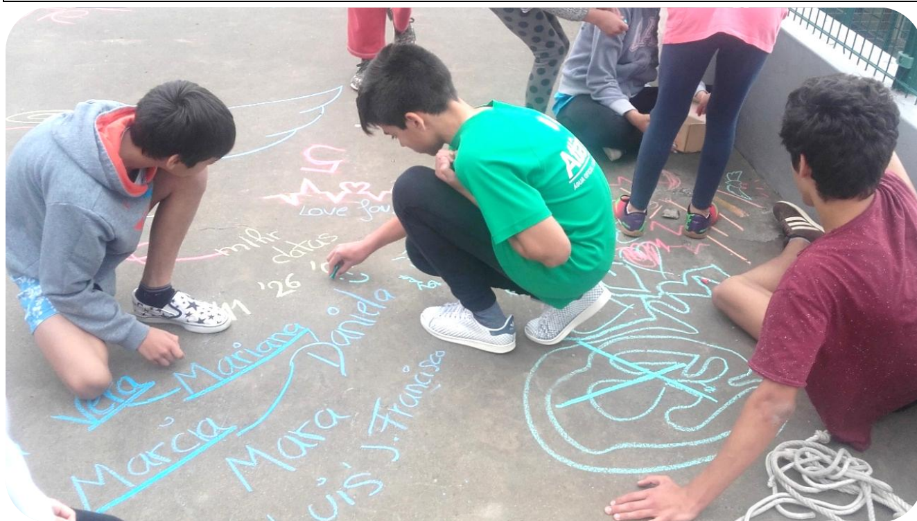
Figura 5 – Atividades Lúdico-Pedagógicas

Proporcionar e enriquecer o tempo livre das crianças/jovens foi fundamental para o seu desenvolvimento saudável, pelo que continuaremos com este projeto no próximo ano.