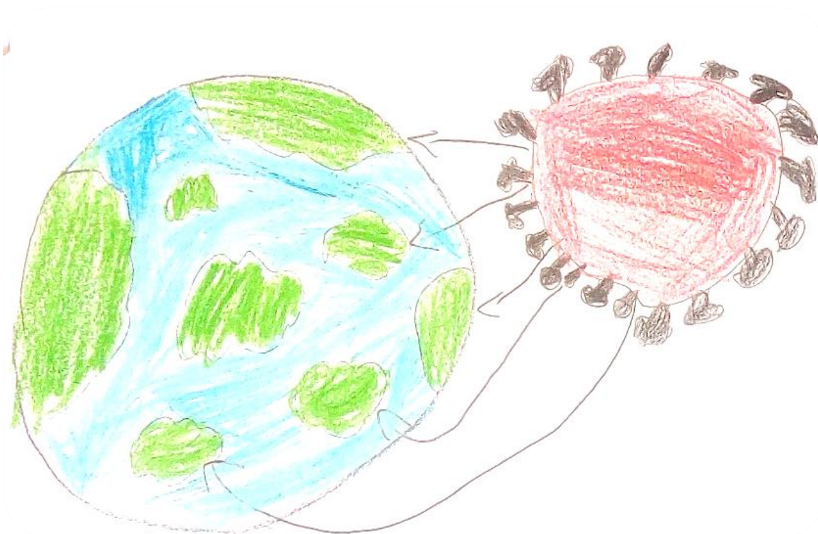
Figura 1 – O Covid e o Mundo