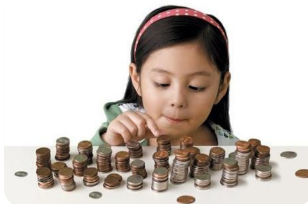
Figura 2 – Gestão do Dinheiro

Consideramos que este projeto cumpriu com os objetivos propostos ao observamos a aquisição de diferentes competências por parte das crianças/jovens de acordo com os seus ritmos e capacidades, em diversos contextos. Assim sendo, “Aprender para ser” continuará a ser desenvolvido em 2021.