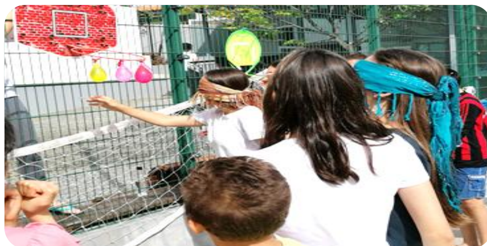
Figura 6 – Dia da Criança

A avaliação positiva atribuída a este projeto motiva a continuidade do mesmo para o próximo ano.