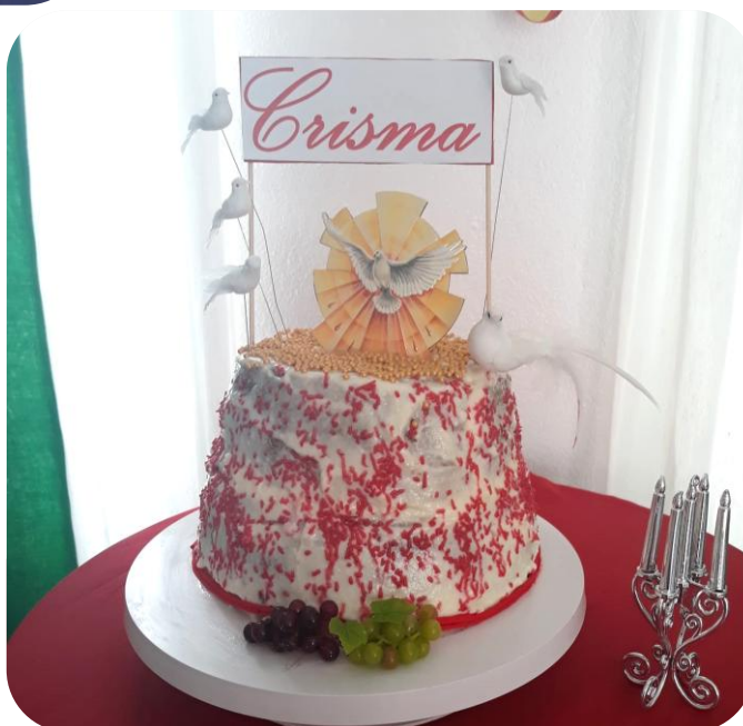
Figura 5 - Crisma