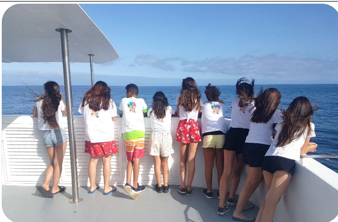
Figura 8 -Atividade Sunset 4 Life

O projeto “Energy 4 Life” foi financiado ao abrigo do Corpo Europeu de Solidariedade (CES), cujo principal objetivo foi promover a prevenção de comportamentos de risco em crianças e jovens. Este projeto teve início em setembro de 2019 e terminou em 2020.